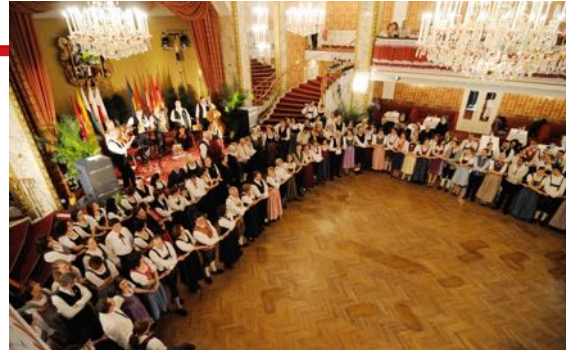
Kathreintanz 2009 - Parkhotel Schönbrunn

Das Haus ist für seine ausgezeichnete Küche und sein schönes Ambiente bekannt, in der hoteleigenen und auch in der öffentlichen Therme ist für jeden Geschmack etwas vorhanden. Das freundliche, hilfsbereite Personal bemüht sich, dem Gast den Aufenthalt so angenehm wie möglich zu gestalten. Also Karten für den Kathreintanz bestellen, hinkommen und mitfeiern – hoffentlich gewinnen und eine erholsame Zeit im Quellenhotel der Heiltherme Bad Waltersdorf genießen!