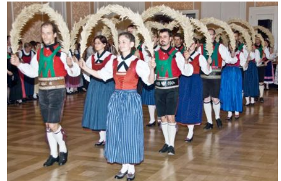
Kathreintanz 2008 - Kursalon Hübner

Seit ich dabei sein durfte – wahrscheinlich seit 1979 – wurden stets Rituale bewusst gepflegt und weitergetragen: eine Kleiderordnung, die feierliche Eröffnung, zu der man sich qualifizieren musste, das Absingen der Hymne vor den Ansprachen, die musikalisch/tänzerische Gestaltung: eine große und eine kleine Musikgruppe auf der