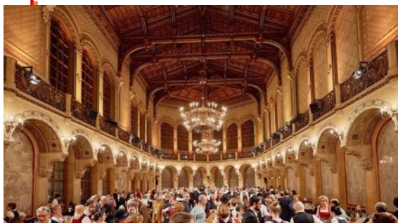
Kathreintanz 2018 - Palais Ferstel

von Neuem über die liebevolle Betreuung seitens des Hauses! Ebenso dankbar sind wir für die Kooperation mit dem Wiener Volksliedwerk und dem Institut für Volksmusikforschung und Ethnomusikologie. Die Hymne wurde um die Europahymne ergänzt, es ist uns ein Anliegen, damit Dankbarkeit für Frieden, Stabilität und Zugehörigkeit zu einem größeren Ganzen auszudrücken, und nicht nationales Gedankengut und Ausgrenzung. Wir bemühen uns um ein geselliges Ereignis mit guter Musik und der Möglichkeit sozialer Kontaktpflege unter Freunden und genießen die vielen sich bestens unterhaltenden Menschen. Es ist überaus erfreulich, dass junge Menschen mit uns das Wagnis der Eröffnung eingehen und wir jedes Mal wieder erfolgreich und mit Spaß einen feierlichen Auftakt begehen können!